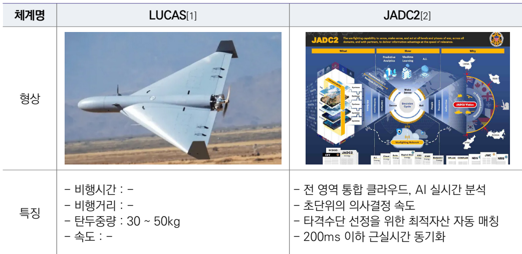
[ 표 1 ] 중동전쟁에서 적극 활용된 미국 신규 무기