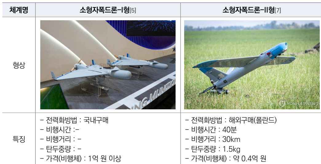
[ 표 4 ] 국내 전력화된 소형자폭드론-I, II