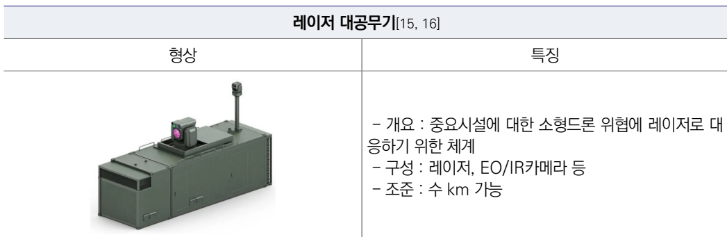
[ 표 9 ] 국내 전력화된 레이저 방식 대드론