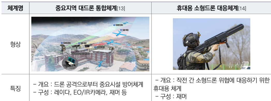
[ 표 8 ] 국내 전력화된 재밍 방식 주요 대드론