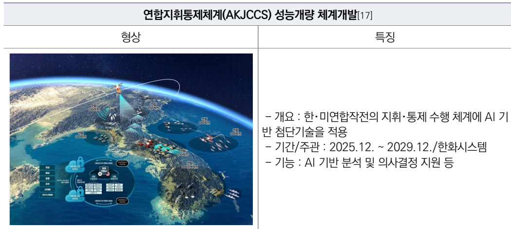
[ 표 16 ] 국내 성능개량 개발 진행 중인 AI 적용 지휘결심